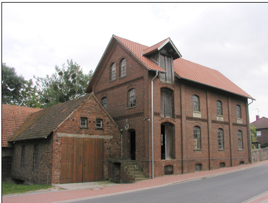
Die „Neue Mühle“ im Jahre 2006